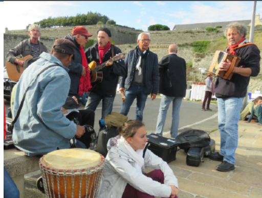
Animation des quais à Boulogne, Belle-Ile-en-Mer...