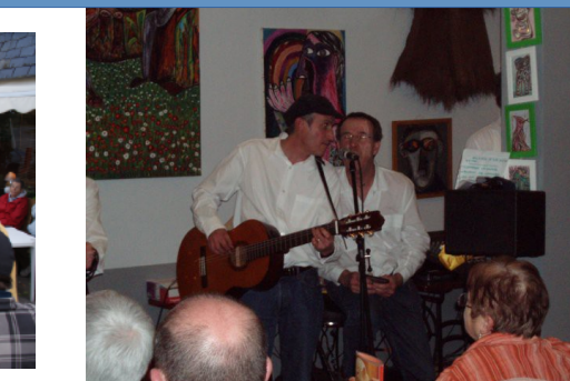
Concerts dans des cafés à Vannes, penerf, Couéron...