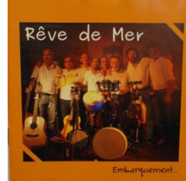
CD 4 - 2012