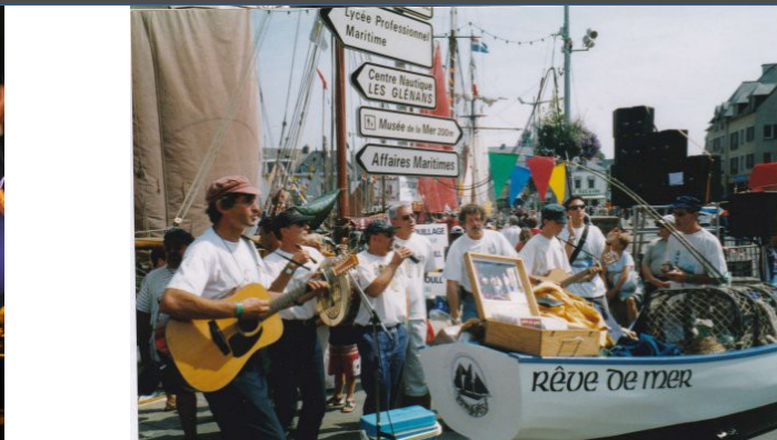
Festivals de Chants de marins : St Jean Port Joli (Québec), Paimpol...