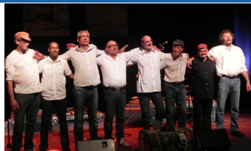
Concerts en salle : Ile d'Yeu, Bouvron...