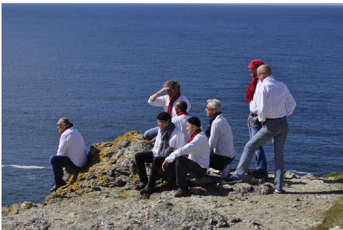
Chants de marins et de la mer