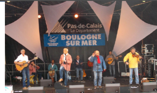
Fêtes de la mer : La turballe, Douarnenez, Boulogne/Mer...