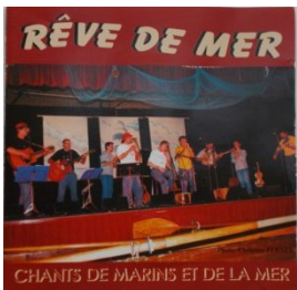
CD 1 - 2001