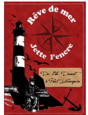
CD -DVD 2017