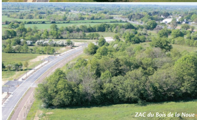
ZAC du Bois de la Noue