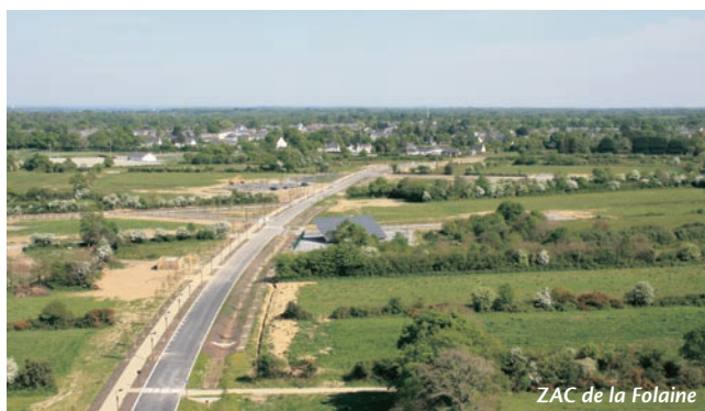
ZAC de la Folaine

A l'issue d'une mise en concurrence, la gestion et le développement des deux zones ont été confiés au groupe Proudreed. Il aura aussi pour mission de démarcher les futures entreprises répondant aux critères fixés par la CCCE. Plusieurs d'entre elles ont déjà fait preuve d'un grand intérêt pour les deux sites. Les premières installations devraient débuter courant 2012. « L'objectif est avant tout de créer de l'activité sur le territoire et donc de nouveaux emplois », conclut le maire. « C'est aussi une démarche très porteuse en termes d'image. Un vrai pari pour l'avenir. »